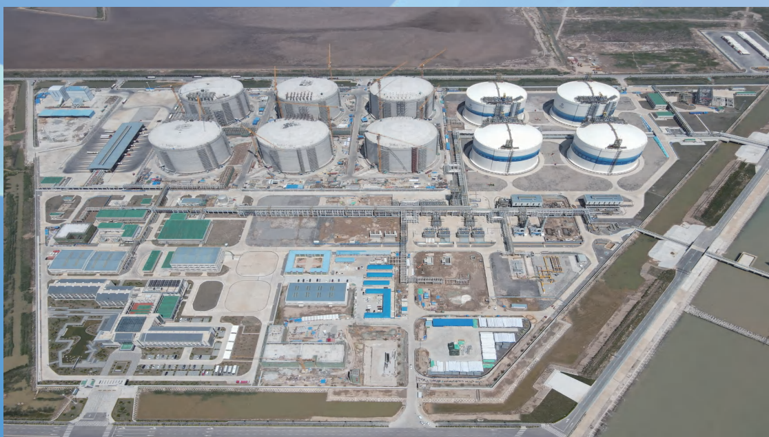
中海油江苏盐城滨海LNG接收站