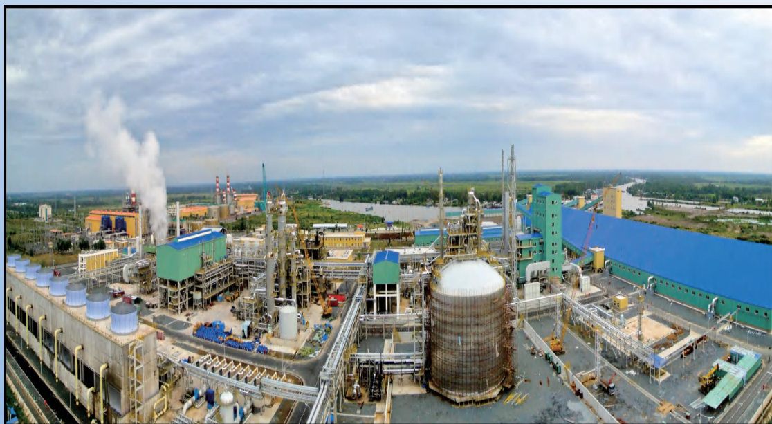
越南金瓯50万吨 每年合成氨，80万吨每年尿素化肥项目