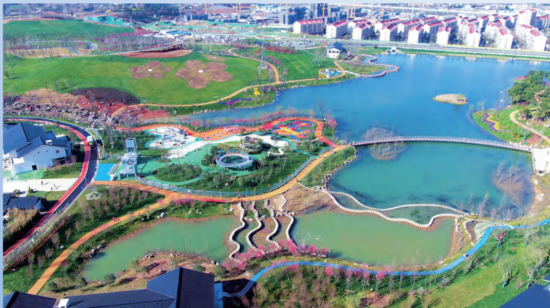
南京江北新区丁解水库环境综合治理项目