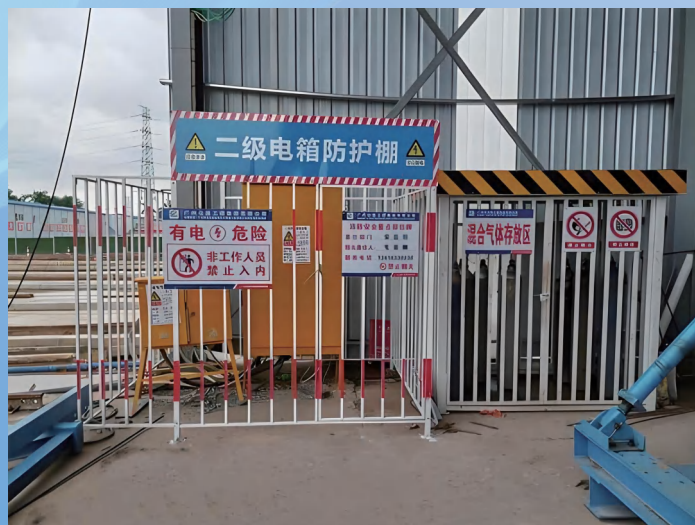
配电箱（一级箱、二级箱、三级箱）