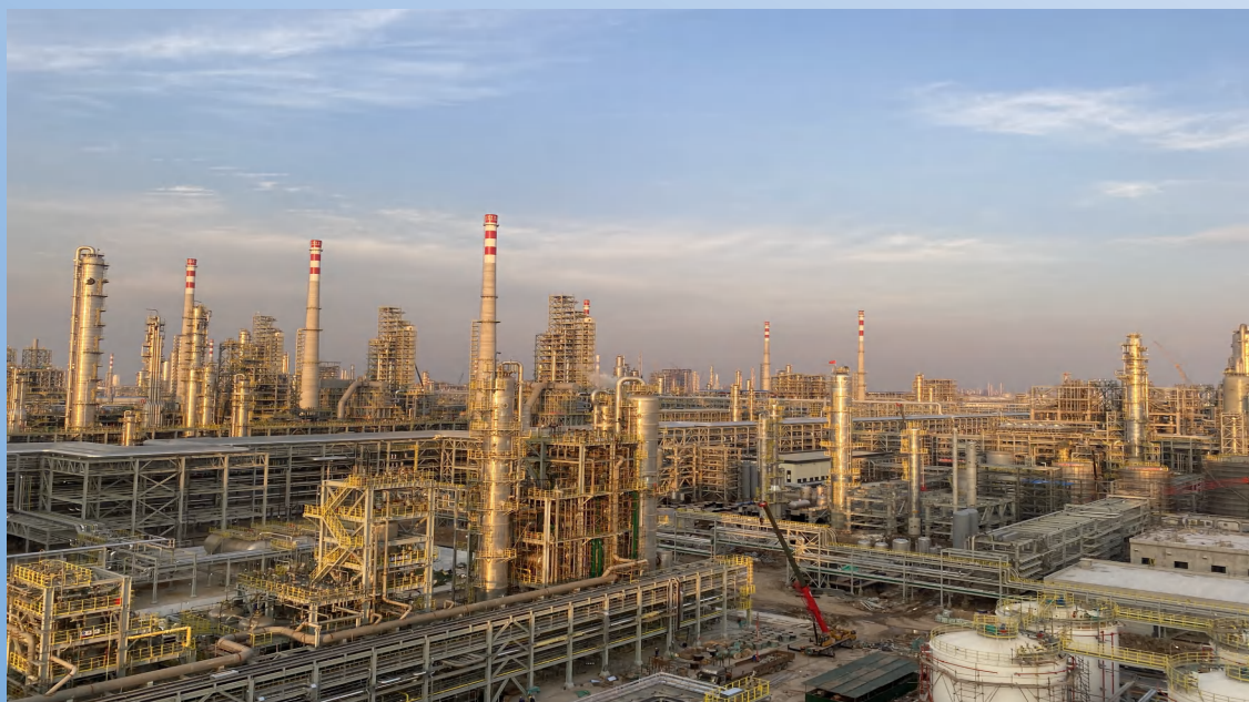
盛虹炼化有限公司连云港炼化一体化项目

中国化学工程第十四建设有限公司设计方面拥有化工石化医药行业甲级设计资质；施工总承包方面拥有石油化工工程施工总承包特级、市政公用工程施工总承包壹级、机电工程施工总承包壹级、建筑工程施工总承包壹级、水利水电工程施工总承包贰级、公路工程施工总承包贰级资质；专业承包方面拥有钢结构工程专业承包壹级、环保工程专业承包壹级、消防设施工程专业承包贰级等资质。公司现为国家高新技术企业，拥有直接对外经营权。