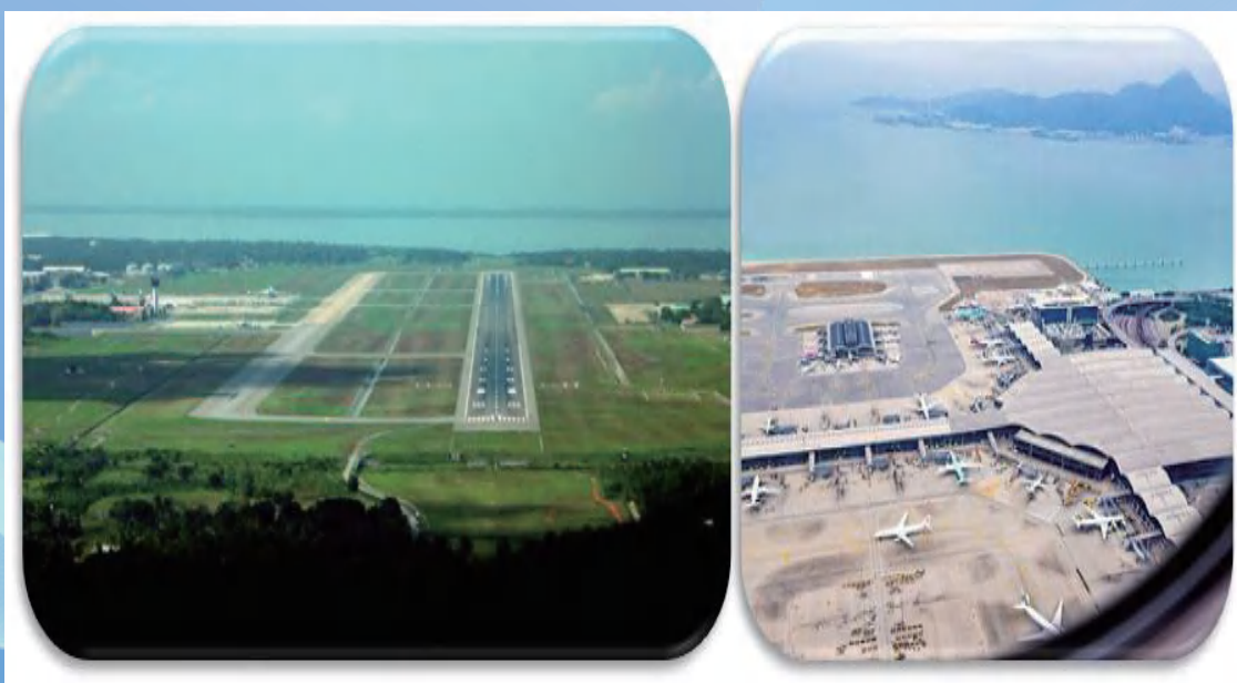
斯兰卡首都卡图纳耶克班达拉奈克国际机场