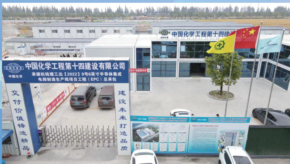
杭州宝鼎乾芯 6 英寸半导体 EPC 总承包项目