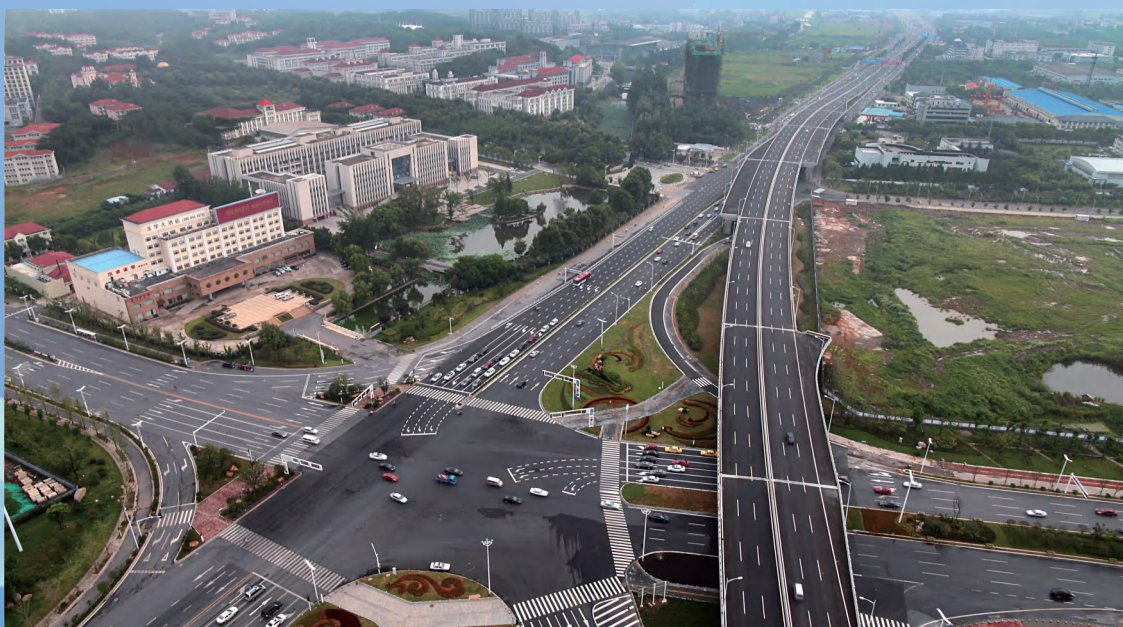
南京市江北大道快速化改造BT项目